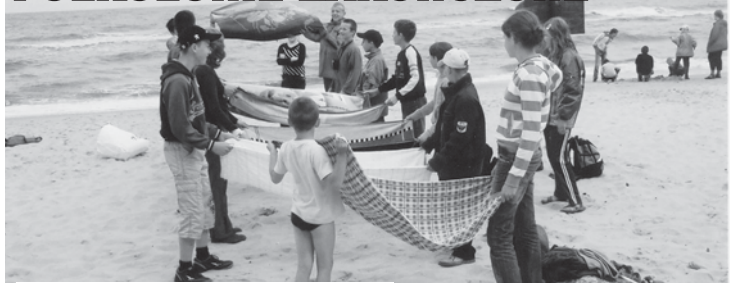
Pomimo kapryśnej pogody uczestnikom pół- kolonii nad Bałtykiem dopisywał dobry humor.

Około 170 dzieci w wieku od 7 do 16 lat z terenu Miasta i Gminy Ostrze- szów wzięło udział w półkoloniach zorganizowanych przez Gminną Komisję Rozwiązywania Problemów Alkoholowych.