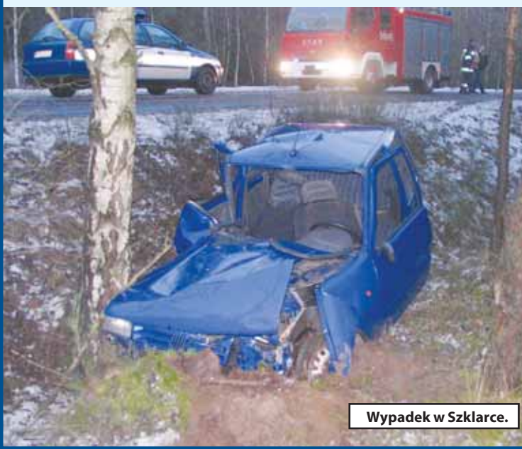
Wypadek w Szklarcze.