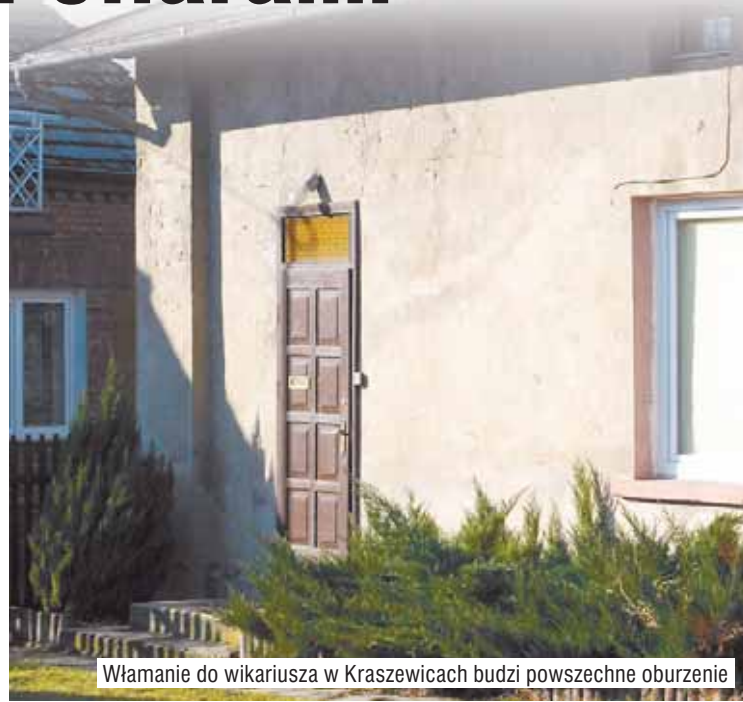
Włamanie do wikariusza w Kraszewicach budzi powszechne oburzenie