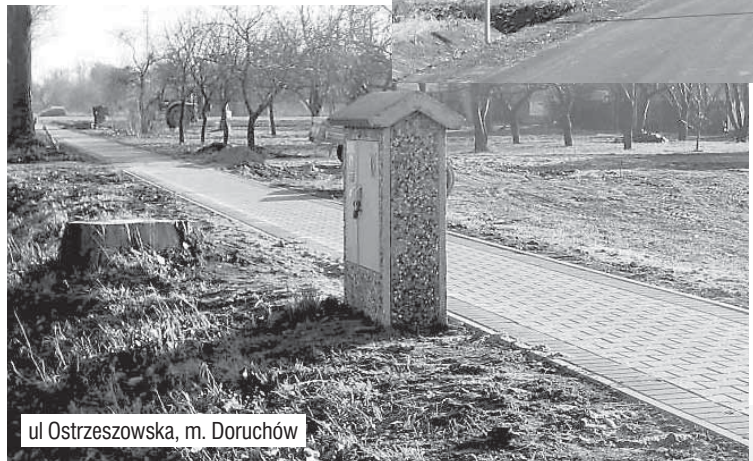
ul Ostrzeszowska, m. Doruchów