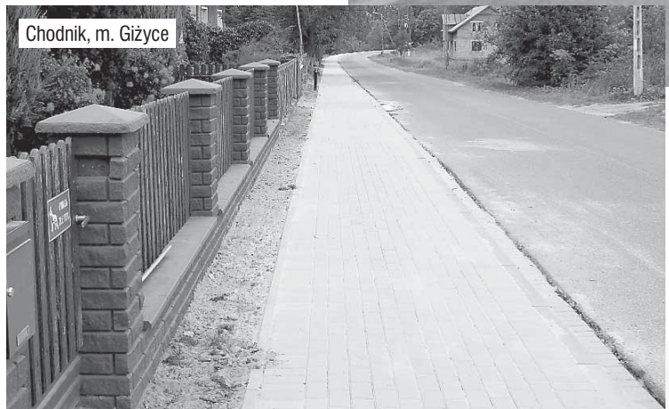
Chodnik, m. Giżyce

Razem w roku 2008 wybudujemy i przebudujemy 1,52 km dróg – 714 tys. zł