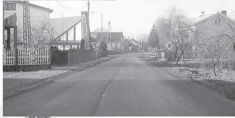
M. Głuszyna g. Kraszewice

Razem wybudowano i przebudowano 4,347 km chodników o wartości 1 mln 123 tys. zł