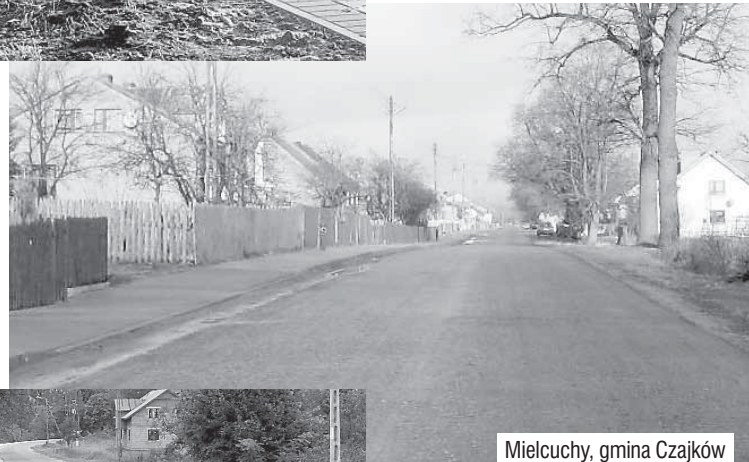
Mieluchy, gmina Czajków