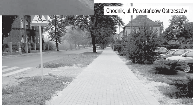
Chodnik, ul. Powstańców Ostrzeszów