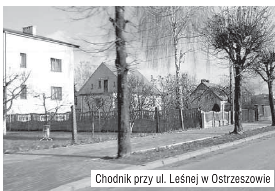
Chodnik przy ul. Leśnej w Ostrzeszowie