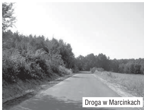
Droga w Marcinkach