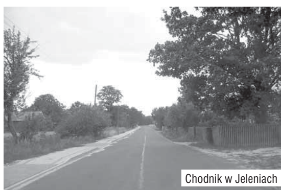
Chodnik w Jeleniach