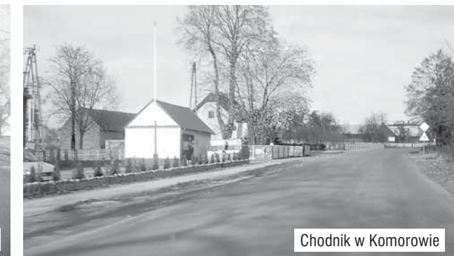
Chodnik w Komorowie