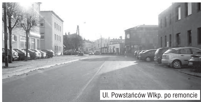
Ul. Powstańców Wilkp. po remoncie