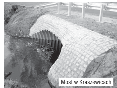
Most w Kraszewicach