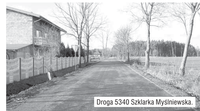
Droga 5340 Szklarka Myślniewska.