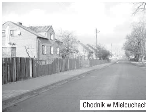
Chodnik w Mielcuchach