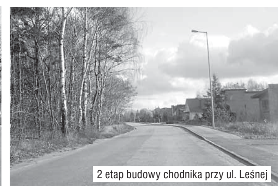
2 etap budowy chodnika przy ul. Leśnej