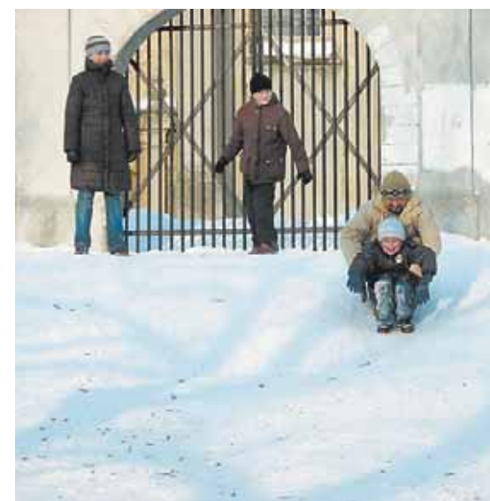
Z górki na pazurki!

Podobają nam się bardzo, a naszym małym czytelnikom na pewno też się spodobają. Zachęcamy innych dziadków, rodziców również, by razem ze swoimi wnuczkami czy dziećmi też ulepiłi coś fajnego ze śniegu. Chętnie o tym napiszemy i pokażemy! Wystarczy telefon do red. 62 730 14 90.