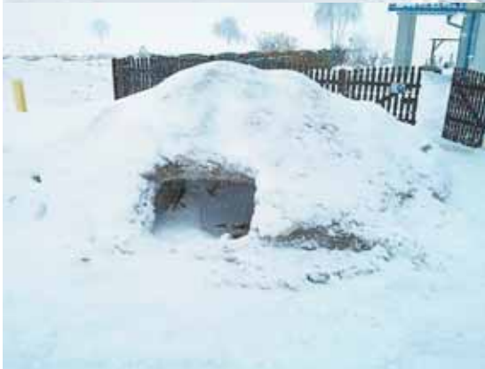
Takie igloo zbudowano w Rekienicach.