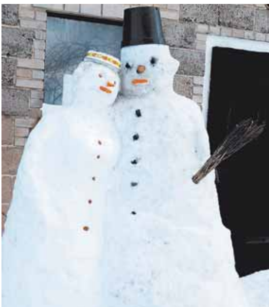
A te przesympatyczne „walentkowe” bałwanki ulepił...