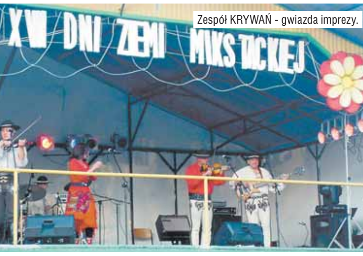
Zespół KRYWAŃ - gwiazda imprezy.