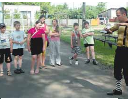
Pokaz sztuczek cieszył się zainteresowaniem dzieci.

Następnie, przy dźwiękach orkiestry, wszyscy rozpoczęli przemarsz na stadion. Obok kościoła czekali szczudlarze, którzy dołączyli do kolumny. Na stadionie odbyły się Mistrzostwa Miasta i Gminy Mikstata w biegach przełajowych w kategoriach młodzieżowych. Można też było podziwiać niezwykle sztuczki iluzjonisty, który dodatkowo świetnie zabawiał dzieci, włączając je do zabawy. Cały czas towarzy-