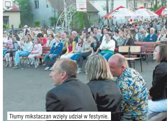
Thumy mikstaczan wzięły udział w festynie.