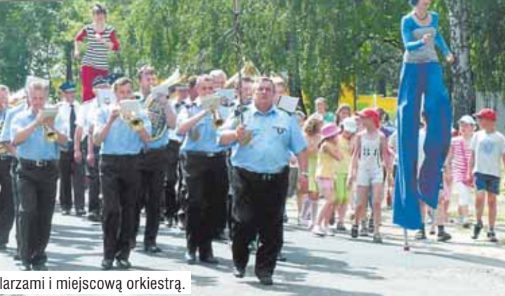
Przemarsz ze szczudlarzami i miejscową orkiestrą.