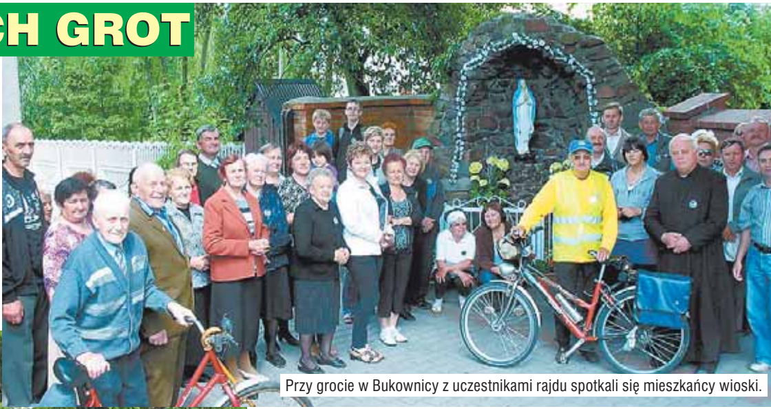
Przy grocie w Bukownicy z uczestnikami rajdu spotkali się mieszkańcy wioski.