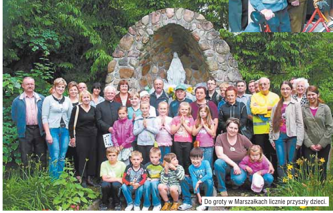
Do grotty w Marszałkach licznie przyszedli dzieci.

dzili się mieszkańcy Bukownicy, Marszałek, Siedlikowa i Mikstatu.