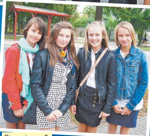
Gimnazjum nr 2.