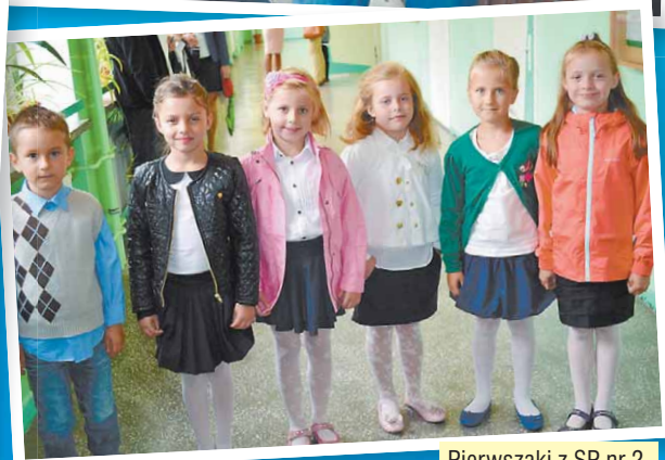
Pierwszaki z SP nr 2.