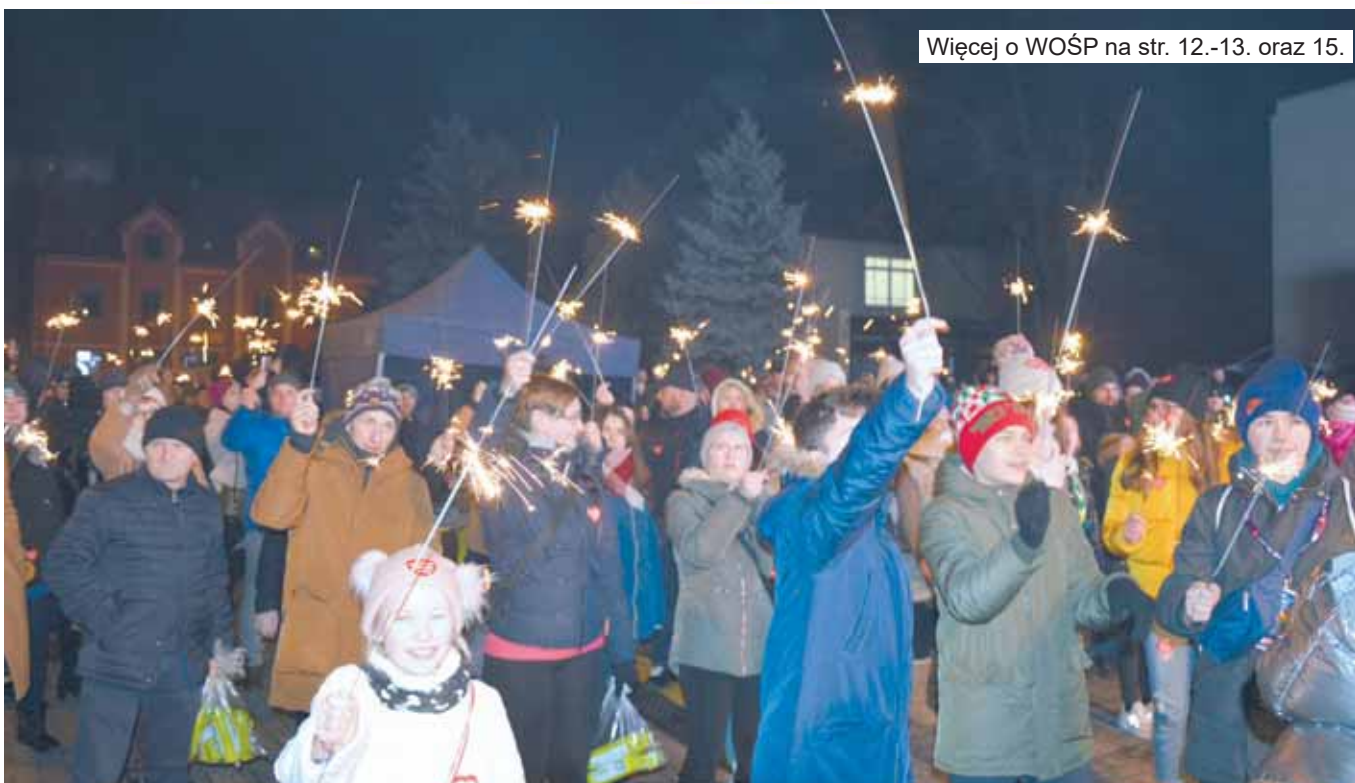
Więcej o WOŚP na str. 12.-13. oraz 15.