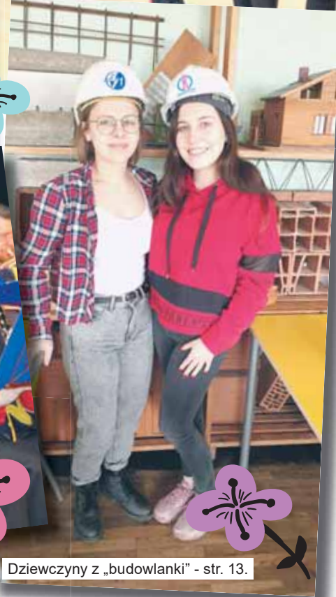
Dziewczyny z „budowlanki” - str. 13.