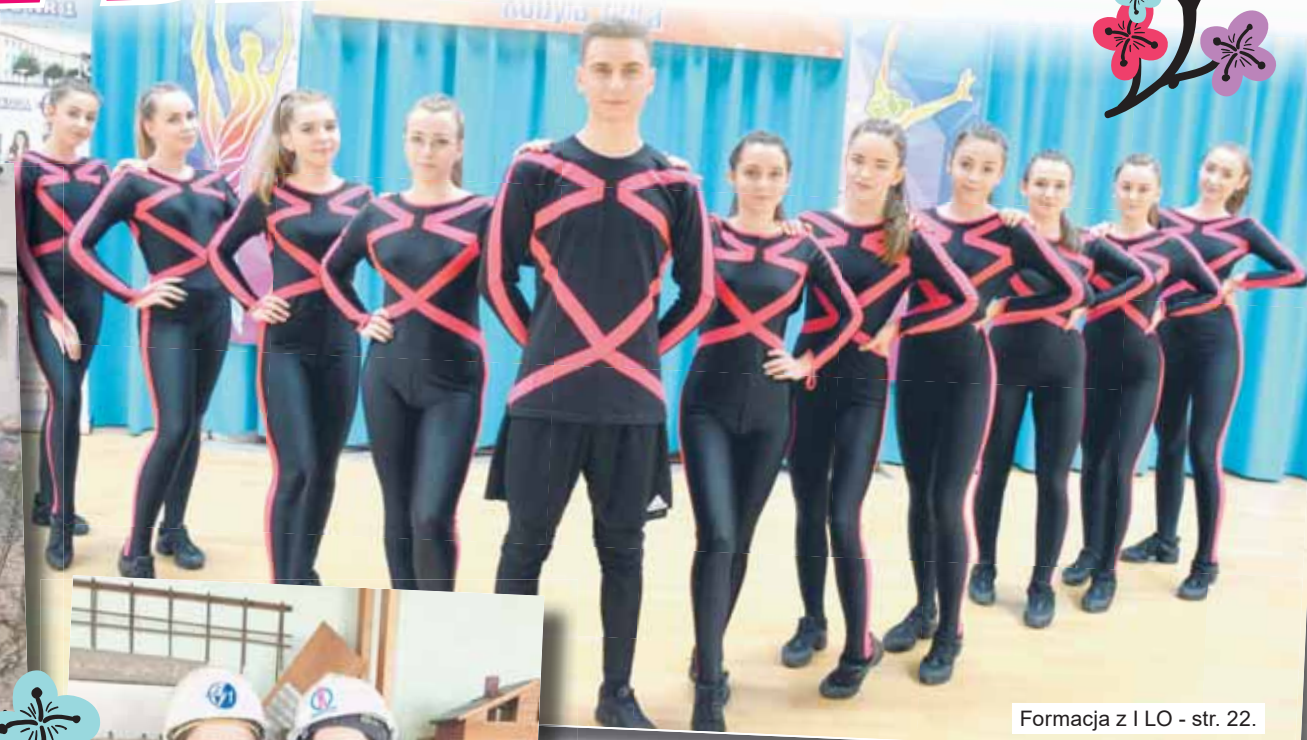
Formacja z I LO - str. 22.