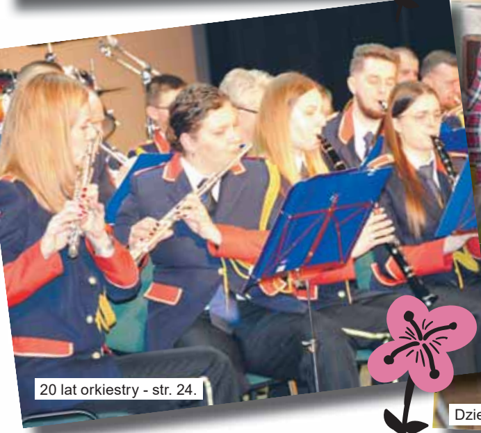
20 lat orkiestry - str. 24.