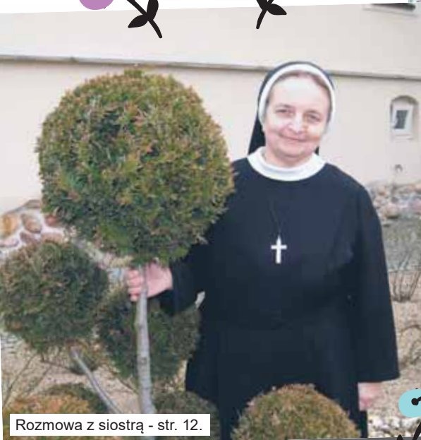
Rozmowa z siostrą - str. 12.