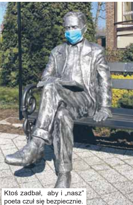
Ktoś zadbał, aby i „nasz” poeta czuł się bezpiecznie.