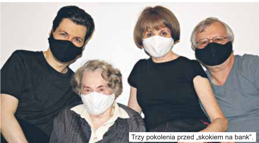
Trzy pokolenia przed „skokiem na bank”.